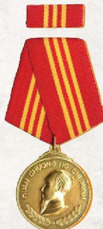
Năm 2005, Hội Liên hiệp Thanh niên Việt Nam vinh dự được Chủ tịch Nước trao tặng Huân chương Hồ Chí Minh

Đã có nhiều thành tích xuất sắc trong công tác tổ chức, vận động thanh niên tham gia các phong trào phát triển kinh tế, văn hoá, xã hội, giữ gìn an ninh quốc phòng, góp phần xây dựng chủ nghĩa xã hội và bảo vệ tổ quốc.