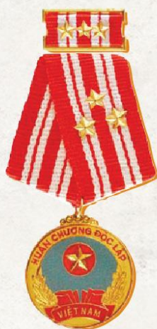
Năm 1999, Hội Liên hiệp Thanh niên Việt Nam vinh dự được Chủ tịch Nước trao tặng Huân chương Độc lập hạng Nhất